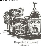
Kapelle St. Josef Eisten