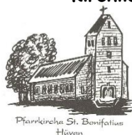
Pfarrkirche St. Bonifatius Hüven